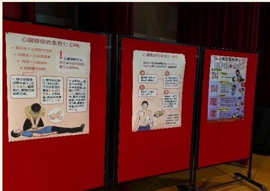
急救訓練宣導海報

內容：邀請新北市聯合醫院-三重院區共同辦理，支援5位訓練指導人員，採小組教學，著重技能演練，授課內容包括講解心肺生理、示範心肺復甦方式以及回覆示教，教學方式活潑，與學員有良好互動，成效良好。參加者於訓練後經過技術考試，參加者可以取得證照，證照有效期限為1年。