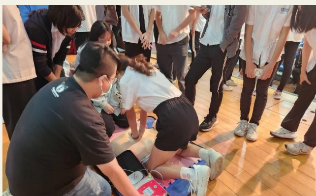
講師及助教示範急救訓練步驟