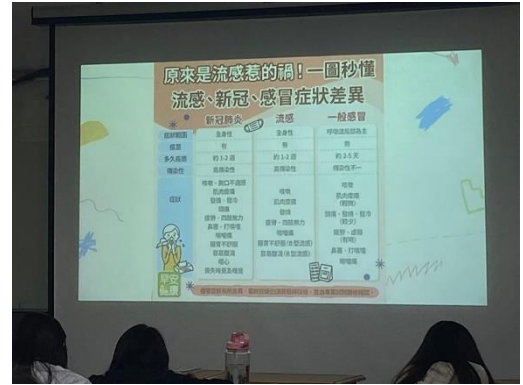
講師講解傳染病症狀差異