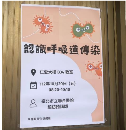
「認識呼吸道傳染」講座海報

內容：邀請臺北市立聯合醫院趙講師以輕鬆有趣的方式講解 PPT，並解說可以建立不同的良好習慣可以避免傳染病發生。透過有獎徵答的模式讓師生有良好互動，預防呼吸道傳染的觀念增加學員認知，有效的建立健康及預防知識。