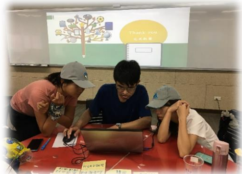
教案活動設計指引撰述