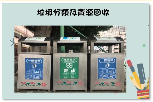
宣導垃圾分類及資源回收