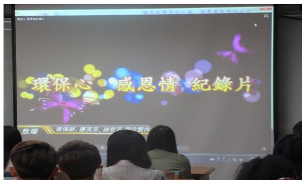
於軍護課播放「環保心 感恩情」

內容：由本校商管系及應英系學生協助拍攝「環保心 感恩情」資源回收紀錄片，內容記錄校園工友每日辛苦回收垃圾的工作，藉此提醒學校學生，隨手做好垃圾分類及資源回收之重要性，資源回收再利用，一起守護地球。