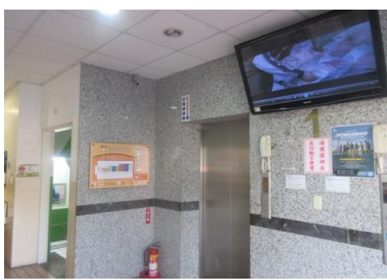
人文大樓電視牆播放「環保心 感恩情」