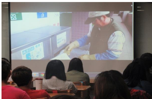
學生觀看「環保心 感恩情」紀錄片