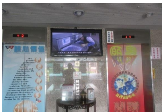
於綜合教學大樓播放「環保心 感恩情」