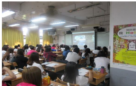
學生觀看「環保心 感恩情」紀錄片