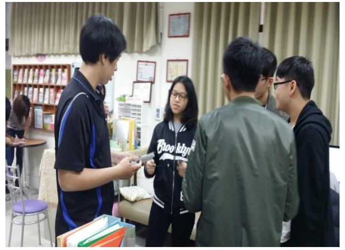
志工說明活動相關辦法