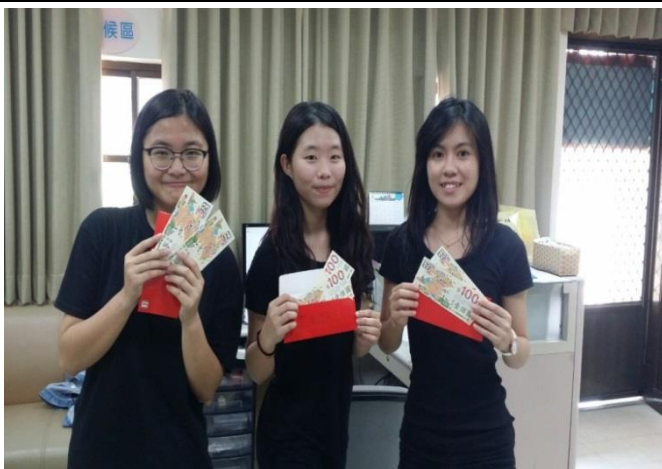
學生完成 20 萬步領取禮券