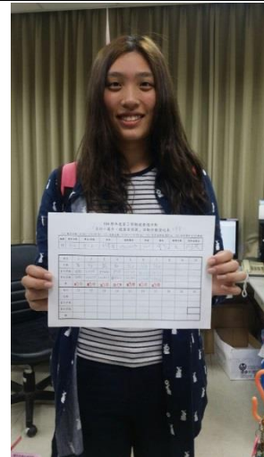
使用計步器日行一萬步，紀錄每日步數