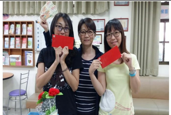
教職員完成 20 萬步領取禮券