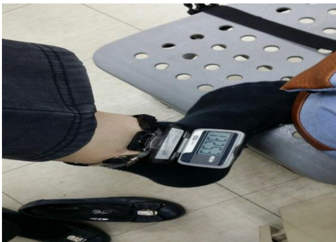
使用計步器日行一萬步，紀錄每日步數