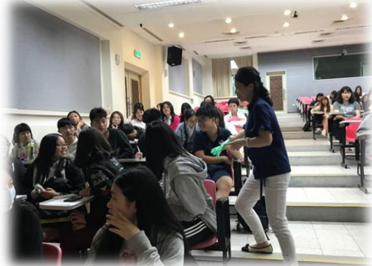
學生獲得精美禮品