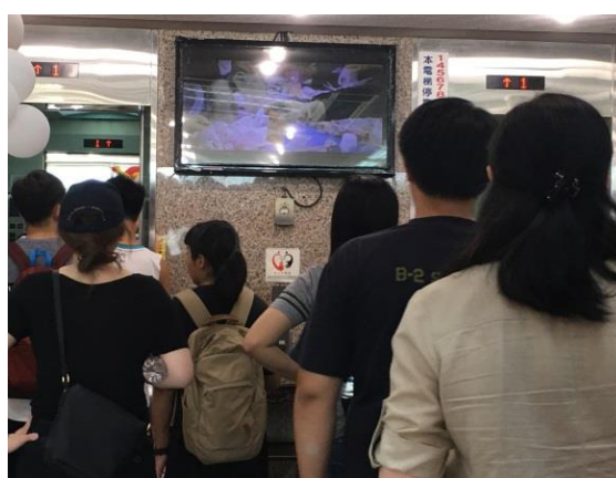
綜合教學大樓播放「環保心 感恩情」