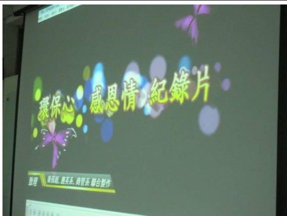
於軍護課播放「環保心 感恩情」

內容：由本校商管系及應英系學生協助拍攝「環保心 感恩情」資源回收紀錄片，內容記錄校園工友每日辛苦回收垃圾的工作，藉此提醒學校學生，隨手做好垃圾分類及資源回收之重要性，資源回收再利用，一起守護地球。