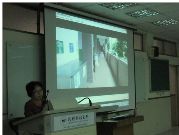
學生觀看「環保心 感恩情」紀錄片