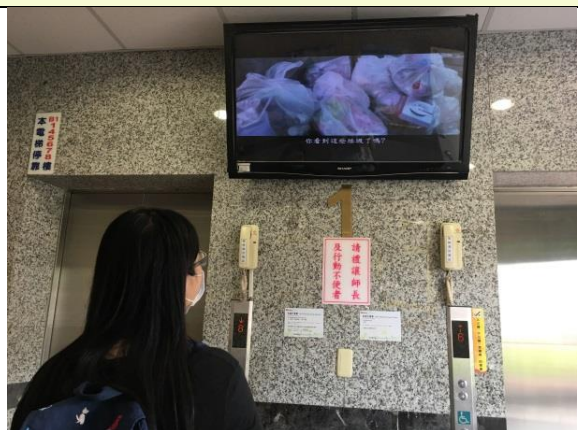
人文大樓電視牆播放「環保心 感恩情」