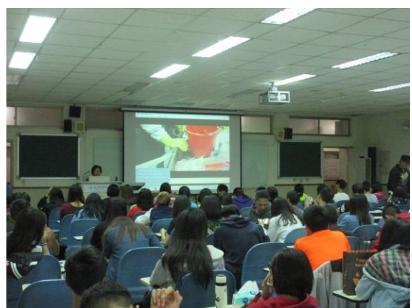
學生觀看「環保心 感恩情」紀錄片