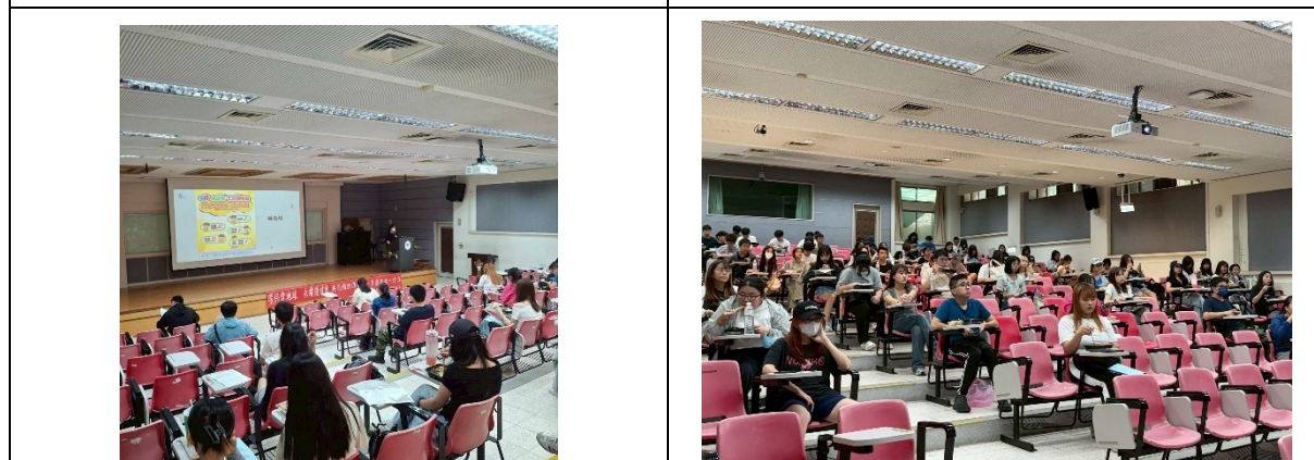
宣導傳染性疾病資訊