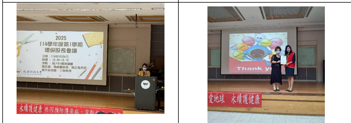
老師講解環保股長相關資訊