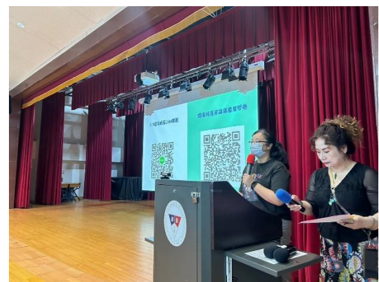
老師講解環保股長相關資訊