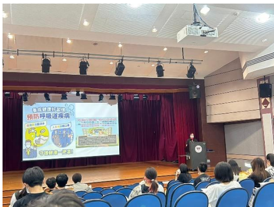
宣導傳染性疾病資訊