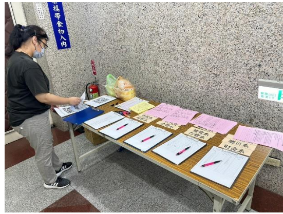
講解環保股長簽到