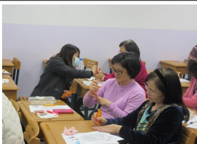
學員實際操作體驗穴道按摩