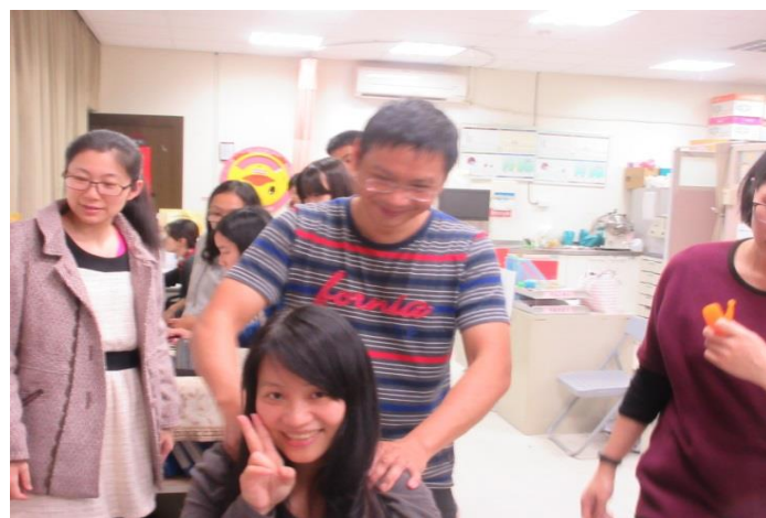
老師體驗穴道按摩