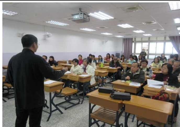
金、木、水、火、土五行介紹