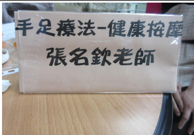
「手足療法，健康按摩」及「鬆筋按摩」

此活動於健康中心進行，提供師生體驗穴道按壓，參加者依自身的身體狀況，經推拿師診斷後依個人身體情況給予適合的穴道調理按壓，放鬆筋骨按摩，以緩解身體緊繃所帶來的疲勞。