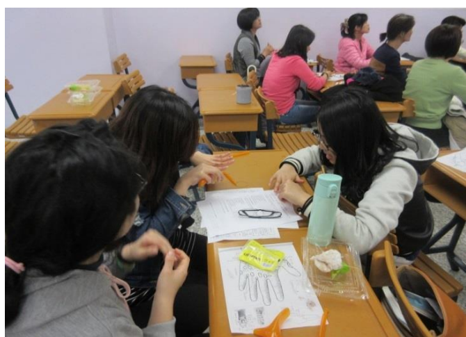
學員互動練習穴道按摩