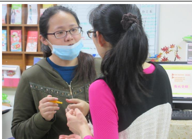
按摩穴道說明及健康諮詢