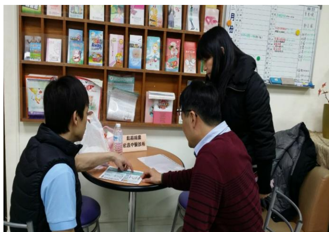
推拿師說明穴道按摩及相關健康問題