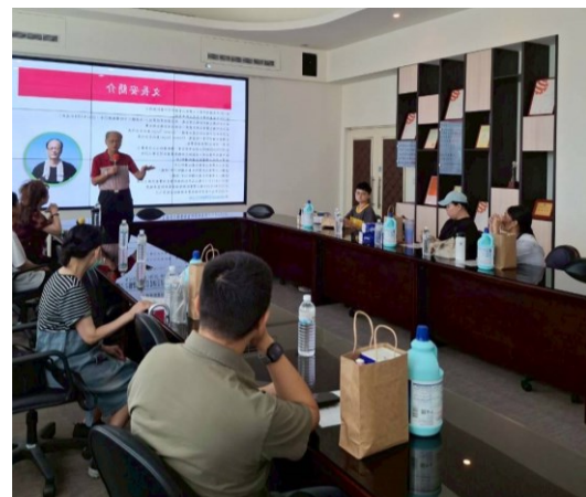
講師講解餐飲衛生相關資訊