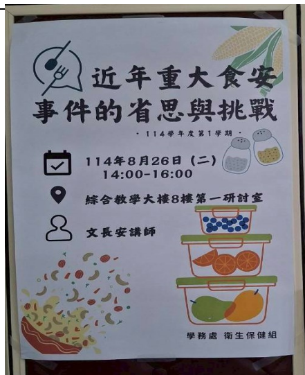
「近年重大食安事件的省思與挑戰」講座海報