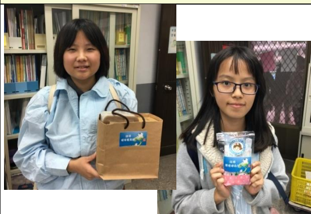
4獎得主及5獎得獎學生