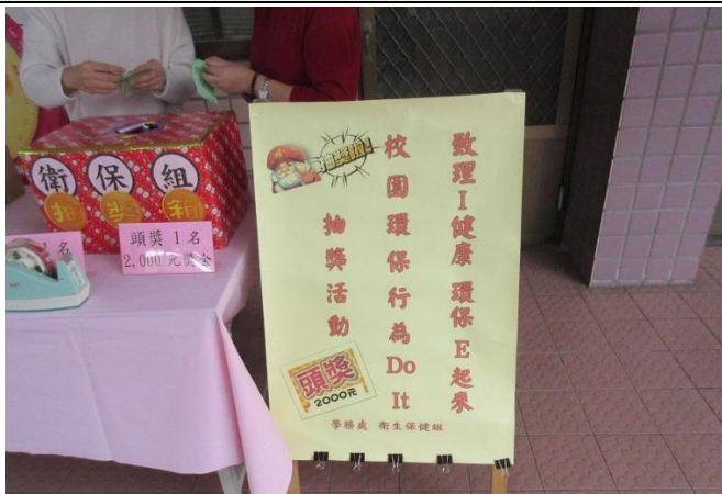
準備「致理 i 健康環保 e 起來」校園環保行為 Do It 活動抽獎