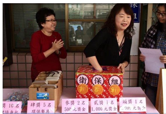
學務長蒞臨抽獎，抽出前四個獎項