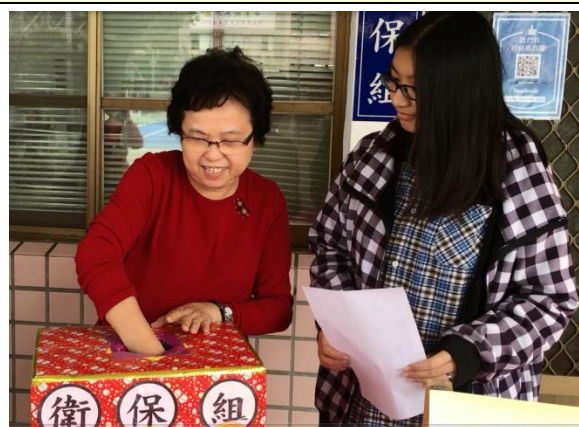
衛保組組長抽出第5個獎項5名