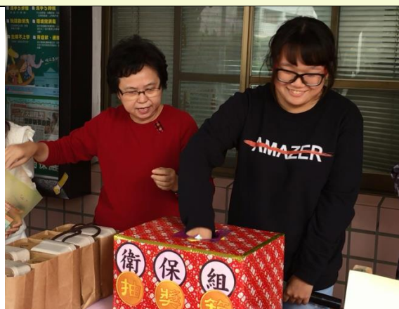
學生議會協助抽出第5個獎項5名