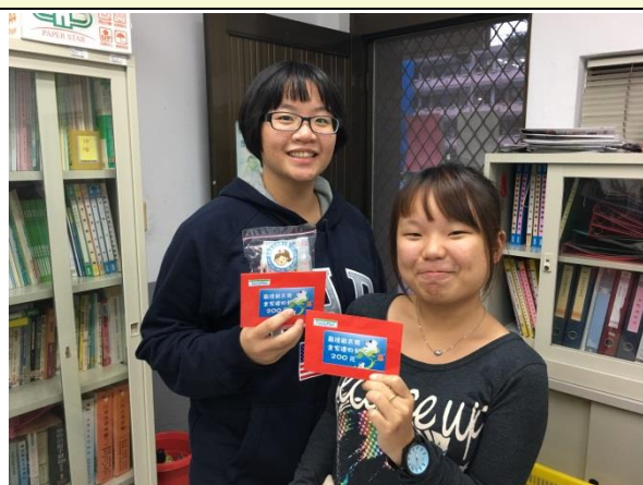
最佳留言及最佳照片得獎學生