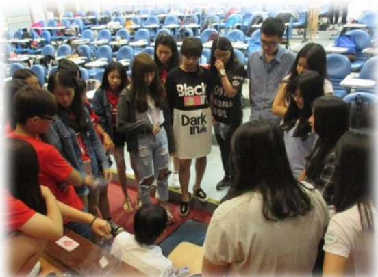
考前再次說明心肺復甦術操作