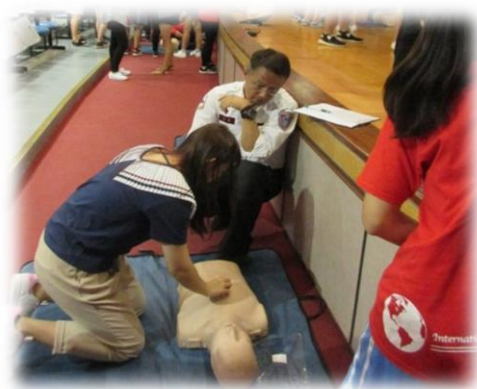
進行心肺復甦術考試