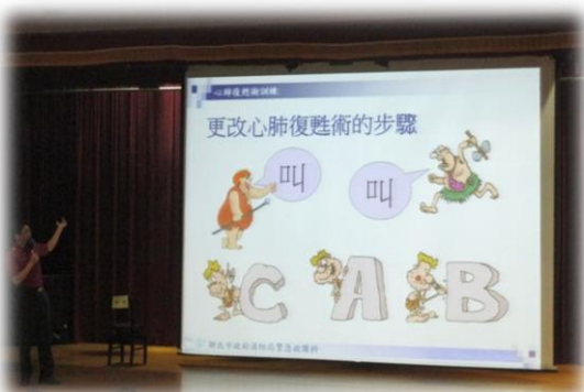
說明 CPR 的口訣