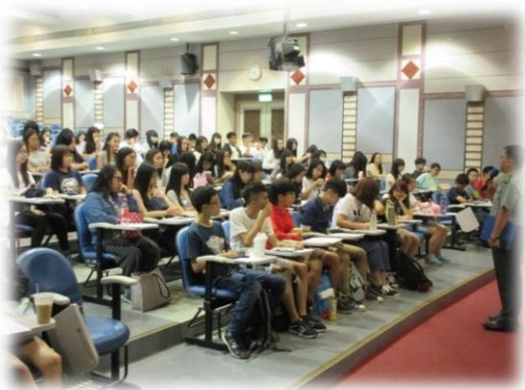
軍訓室教官開場引言

內容：邀請新北市政府消防局民生分隊共同辦理，支援5位訓練指導人員，採小組教學，著重技能演練，授課內容包括講解心肺生理、示範心肺復甦方式以及回覆示教，授課方式活潑，與學員有良好互動，學習成效良好。參加者於訓練後經過技術考試，100%參加者取得證照，證照有效期限為1年。