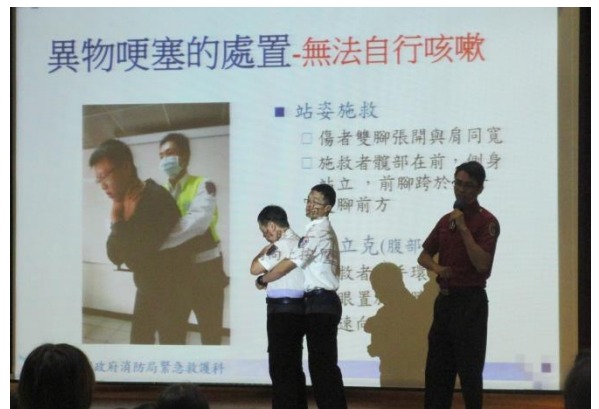
說明哈姆立克法及助教示範