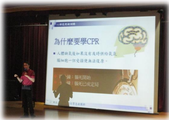
說明 CPR 的重要性