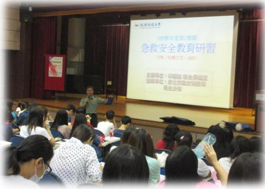
軍訓室總教官開場引言

內容：邀請新北市政府消防局板橋分隊共同辦理，支援5位訓練指導人員，採小組教學，著重技能演練，授課內容包括講解心肺生理、示範心肺復甦方式以及回覆示教，授課方式活潑，與學員有良好互動，學習成效良好。參加者於訓練後經過技術考試，100%參加者取得證照，證照有效期限為1年。