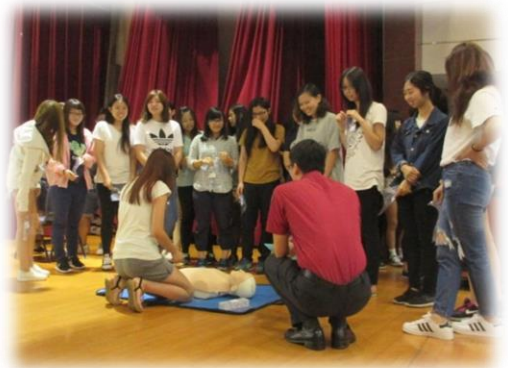
進行心肺復甦術考試