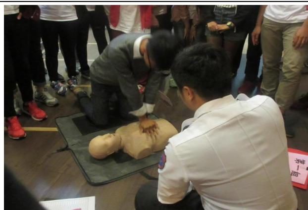
學生進行心肺復甦術考試