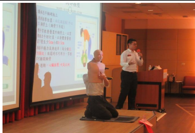
講師講述胸外按壓之方法