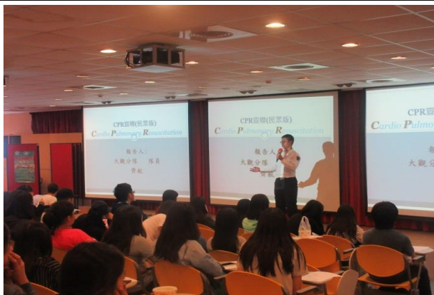
新北市板橋區消防局大觀分隊蒞臨指導

內容：邀請新北市政府消防局大觀分隊共同辦理，支援3位訓練指導人員，採小組教學，著重技能演練，授課內容包括講解心肺生理、示範心肺復甦方式以及回覆示教，授課方式活潑，與學員有良好互動，學習成效良好。參加者於訓練後經過技術考試，100%參加者取得證照，證照有效期限為1年。