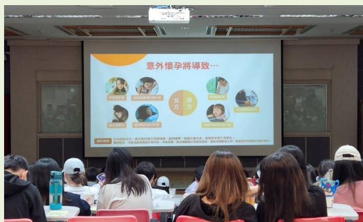
說明意外懷孕可能導致的後果