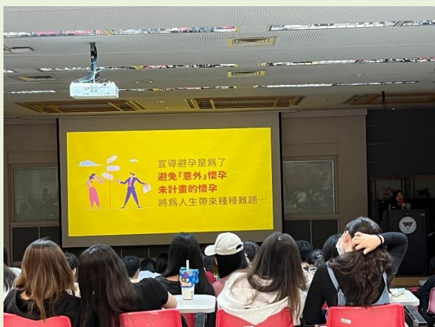
宣導避孕是為了避免意外(未計畫)懷孕