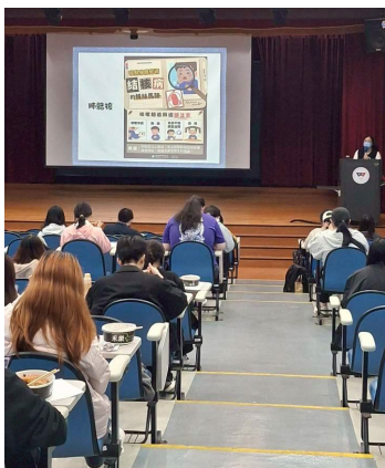
宣導傳染性疾病資訊