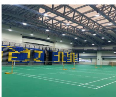
誠信館六樓-專業羽球場